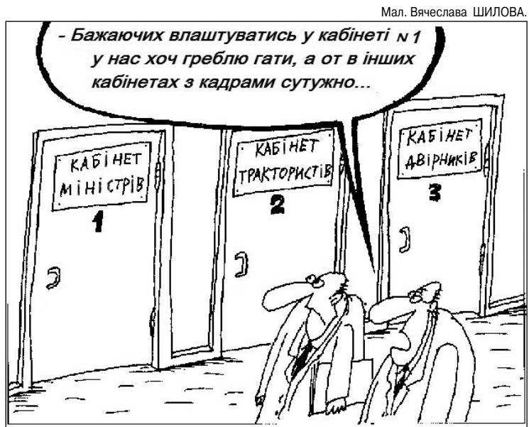
Мал. Вячеслава ШИЛОВА.