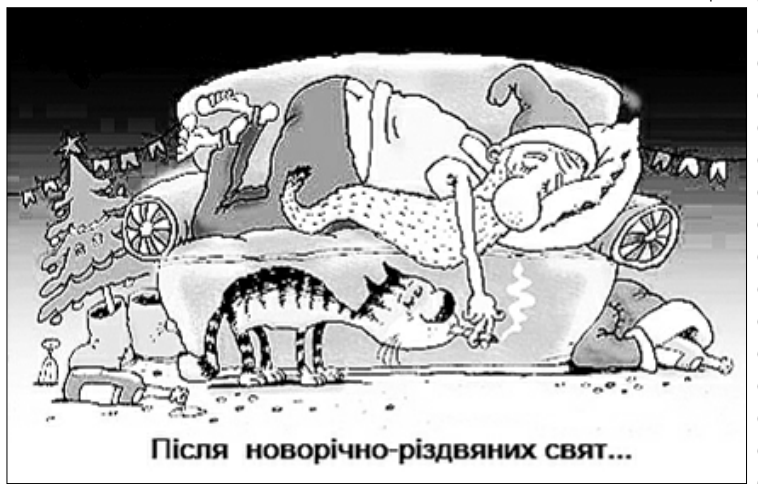
Після новорічно-різдвяних свят...