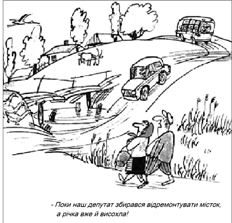
– Поки наш депутат збирався відремонтувати місток, а річка вже й висохла!