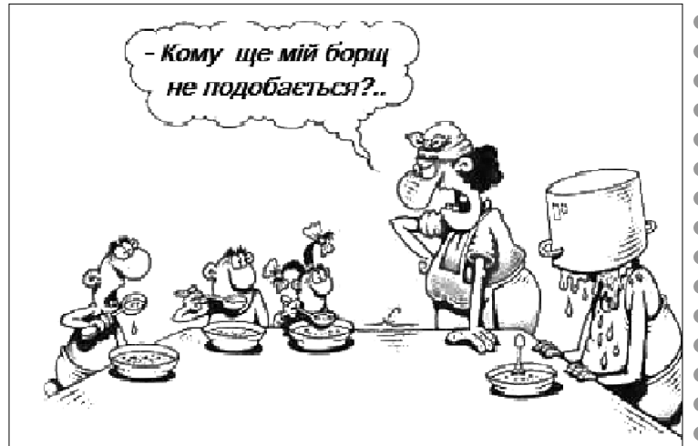
Мал. Ігоря КІЙКА.

З пункту А до пункту Б вирушив поїзд, швидкість якого 140 км/год, а з пункту Б назустріч йому рушив інший поїзд зі швидкістю 160 км/год. Питається: навіщо рушив другий поїзд, якщо та залізниця – одноколіянка?