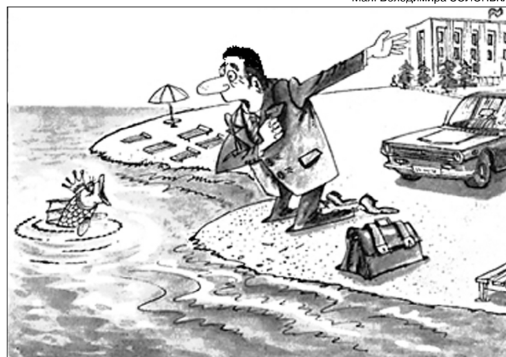
Мал. Володимира СОЛОНЬКА.

із овочів ніхто не поспіває! – От, кажуть, паразитка я... Дурниця! – підскачила Звичайна Повитиця. – На будь-які стеблі в Городі чи в саду я сама для себе живлення знайду. – А я всім зерновим товариш, брат і друг! – горлає на всю ниву якийсь Метлюг. – Я теж, – кричить Кукіль, – зробив рішучий крок, приставши до Пшениці в блок, так само, як зробив колись у вас під носом Мишій, що мудро об'єднався з Просом. – Об'єднуватись?! Ні, – зірвався Курай і покотився ген за виднокрай, – допоки кожен мені в очі коле, що я ледаще Перекотиполе!.. – У цім Городі нині все не так, – відзначив самовпевнений Будяк. – От коли б знову я туди проник, то перш за все звільнився б від мотик. – А ще й Сапа там творить геноцид – це ж сором і ганьба на цілий світ! З Городу геть Сапу! – прорік Осот, – і ми досягнемо значних висот! Мораль: Тепер, здається, всім нам зрозуміло, та не знімаймо і з Господаря вина, як на городі в нього будуть бур'яни.