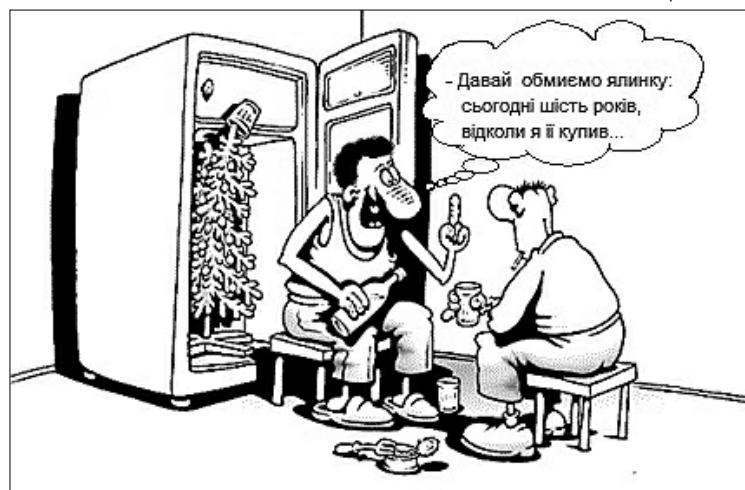
– Давай обмиємо ялинку: сьогодні шість років, відколи я її купив...

медем бідолашний Заєць, – я і в думці такого не мав. Я завсігди поважав вашу світлість... – Чого до мене апелюєш? – визвірився Ведмідь. – Галлявіну переконую, вона виноситиме присуд. Та вухатий недарма вважався в лісі невинним простаком, він врізав без зайвої дипломатії: – Воно-то так, ваша світлість, галлявіна – велика сила, та вона тільки слухає, а вирішує пень. Іван ВЛАСЕНКО. Сумська обл.